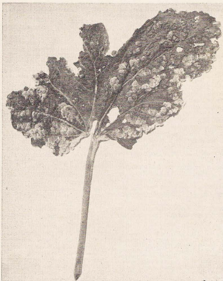
FIG. 2. Fôlha de quiabeiro apresentando numerosas galhas.

Aceria esculenti é disseminado de planta para planta pelo vento, localizando-se sobre os órgãos verdes e tenros do quiabeiro, onde passa a alimentar-se da seiva com o auxílio das quelíceras delgadas. Ao mesmo tempo que se alimenta, introduz no tecido uma toxina responsável pela proliferação celular com a formação de galhas (eríneas), onde passa a viver abrigado (Fig. 2 e 3). O ciclo biológico é simples e direto: após a eclosão ocorrem dois estádios ninfais, o segundo produzindo o adulto depois de passar por um período de repouso (pseudopupa). As galhas, que aparecem sobre os órgãos verdes, algumas vezes adquirem intensa pigmentação avermelhada, peculiar à variedade de quiabeiro envolvida. Os frutos atacados tornam-se imprestáveis para o comércio e, quando as galhas se localizam na brotação terminal, ocorre a paralização do crescimento do quiabeiro. Há imediatamente uma emissão de brotação lateral, que também é atacada, tornando-se então a plan-