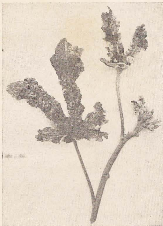
FIG. 3. Fôlhas de brotação de quiabeiro apresentando galhas.

ta improdutivo. Os danos observados no inverno são maiores, possivelmente devido a um menor desenvolvimento da planta na época mais fria do ano.