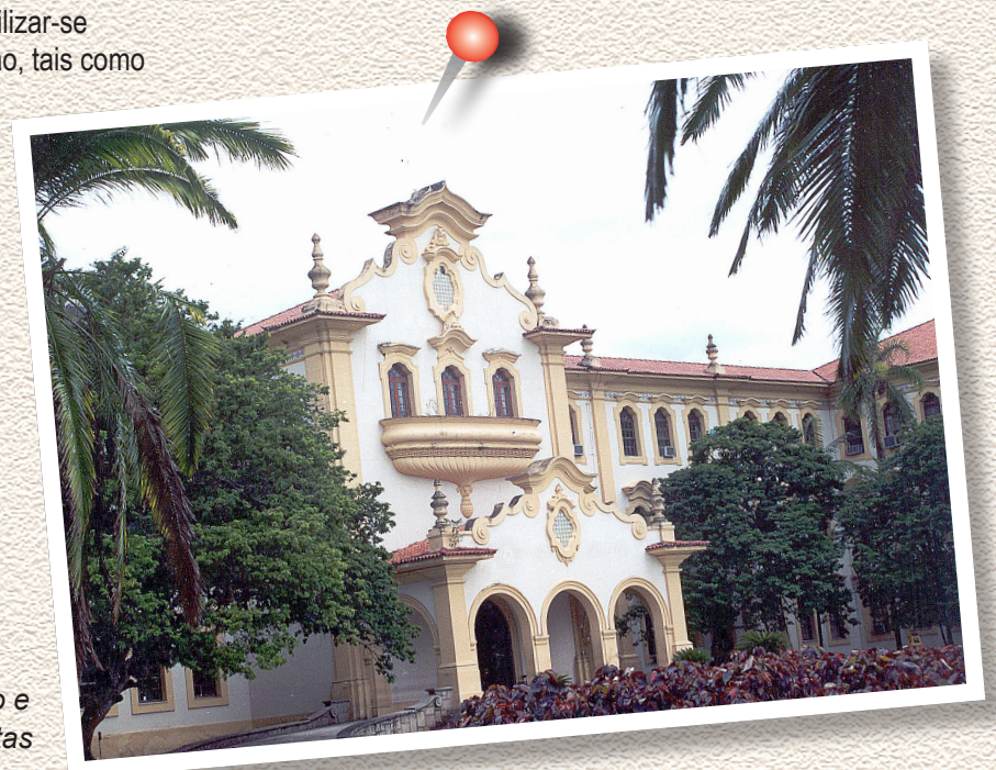
Pavilhão central

Com o objetivo de apoiar alunos com carência de recursos financeiros a Universidade oferece a Bolsa Permanência. Este programa destina-se a alunos de graduação em situação de vulnerabilidade sócio-econômica, visando à oferta de apoio para alimentação, transporte, moradia e apoio acadêmico,