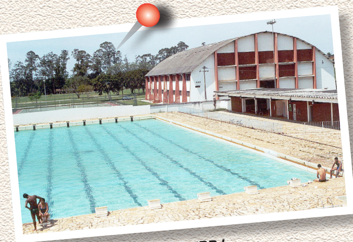
A Praça de desportos da UFRRJ

estudante, foto 3x4, comprovante de matrícula e preencher um formulário disponibilizado na recepção da Biblioteca.