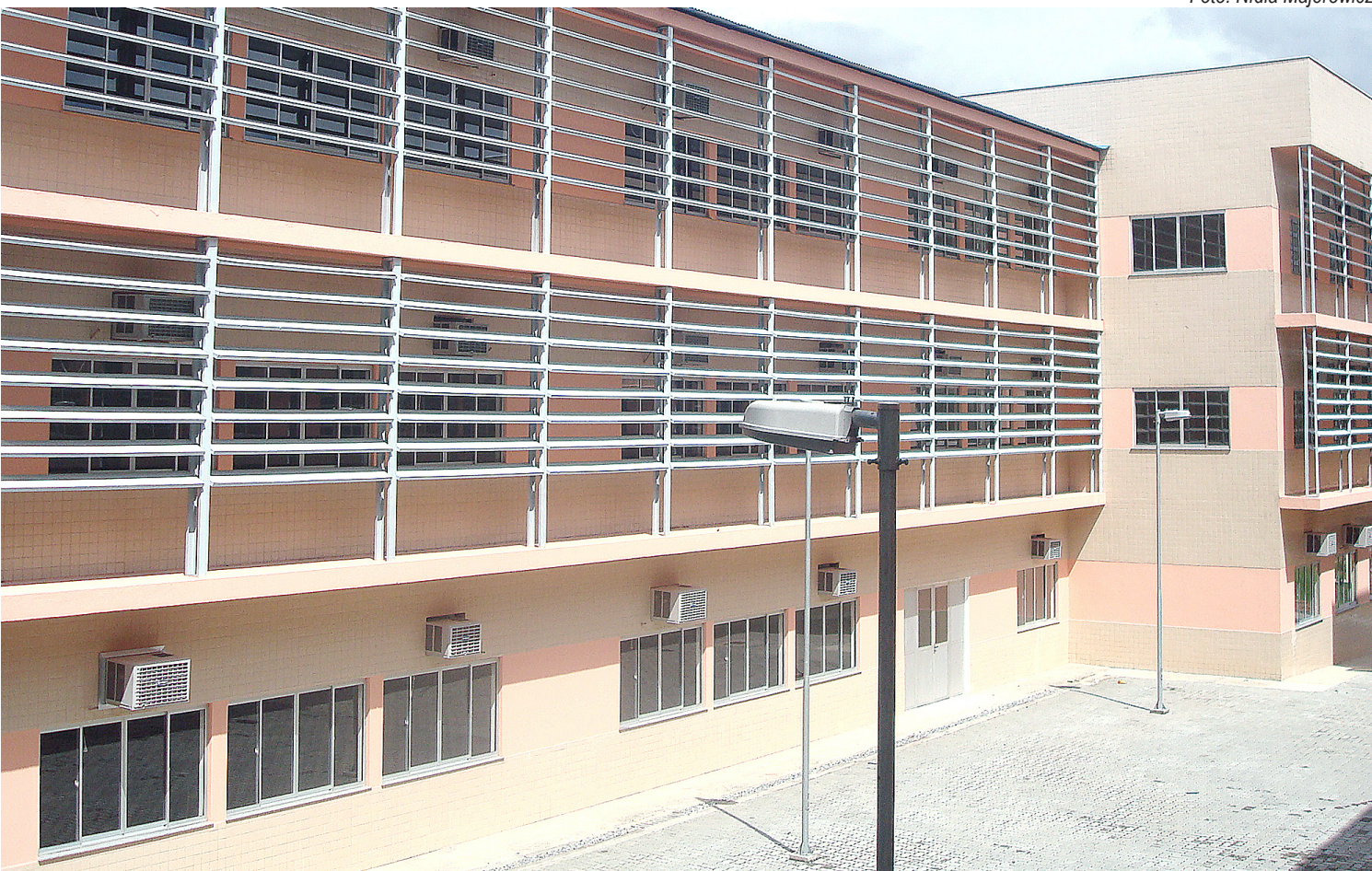
O Instituto Multidisciplinar, em Nova Iguaçu, está instalado em prédio próprio desde abril de 2010