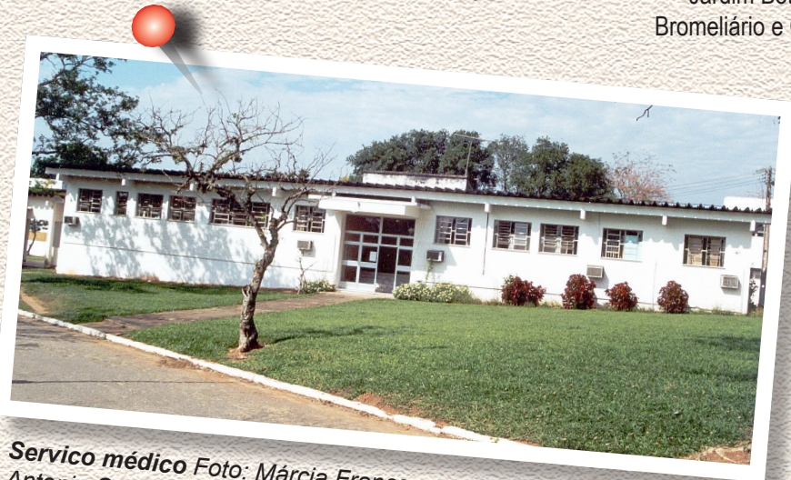
Serviço médico

A Universidade dispõe de um Posto de Saúde (PS/UFRRJ) com atendimento 24h. Localizado entre o Hotel Universitário e os alojamentos femininos o PS UFRRJ realiza, esporadicamente, em parceria com a prefeitura de Seropédica, exames de sangue, como nos períodos de surto de dengue. No local é realizado atendimento ambulatorial primário e também remoções em casos mais graves.