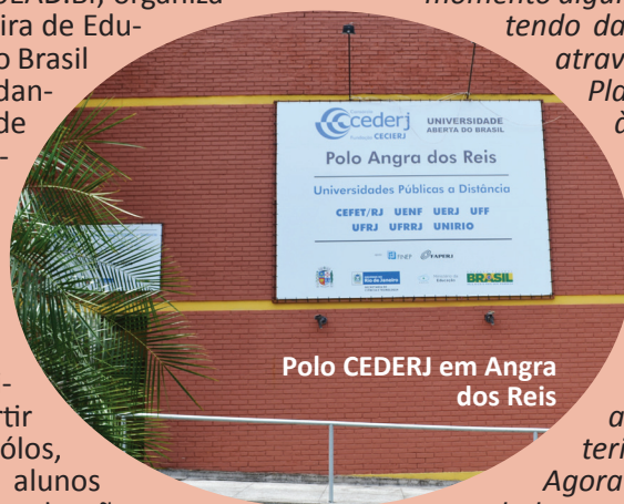
Polo CEDERJ em Angra dos Reis

E: Já ouvi falar sim na mobilidade, e como não sou radical, poderia me inscrever em uma ou duas disciplinas.