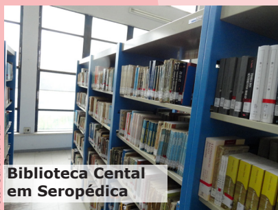
Biblioteca Central em Seropédica