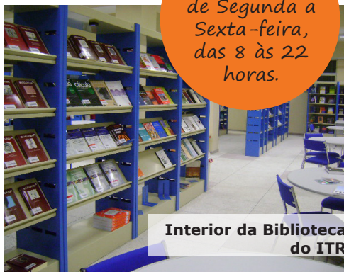
Interior da Biblioteca do ITR

Funcionamento de Segunda a Sexta-feira, das 8 às 22 horas.