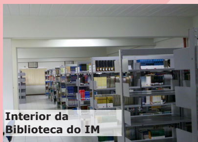
Interior da Biblioteca do IM

As obras das bibliotecas têm referências que as identificam. Para saber a referência de uma obra e sua localização na estante, basta consultar o acervo online através dos computadores disponíveis na entrada, ou de qualquer computador. Ao fazer a busca pelo título, aparecerá quantos exemplares há disponíveis, se são de consulta ou de empréstimo, e sua referência. A biblioteca de Seropédica possui quatro salões com os títulos. No salão A, há obras de referência de 0 a 569.99. No salão B, de 570.00 a 999.99. Nos salões C e D há periódicos de A a F, e de G a Z, respectivamente. Exemplo: a obra de referência 302 D287s se situa no salão A, em uma das primeiras estantes por ser a letra D. O empréstimo de obras varia de acordo com o usuários. Professores podem pegar quatro títulos no prazo de 28 dias, em Seropédica, e 30 dias no IM. Alunos de graduação e CTUR tem direito a dois livros durante sete dias, já alunos de Pós-Graduação, monitores, e funcionarios duas obras durante 14 dias.