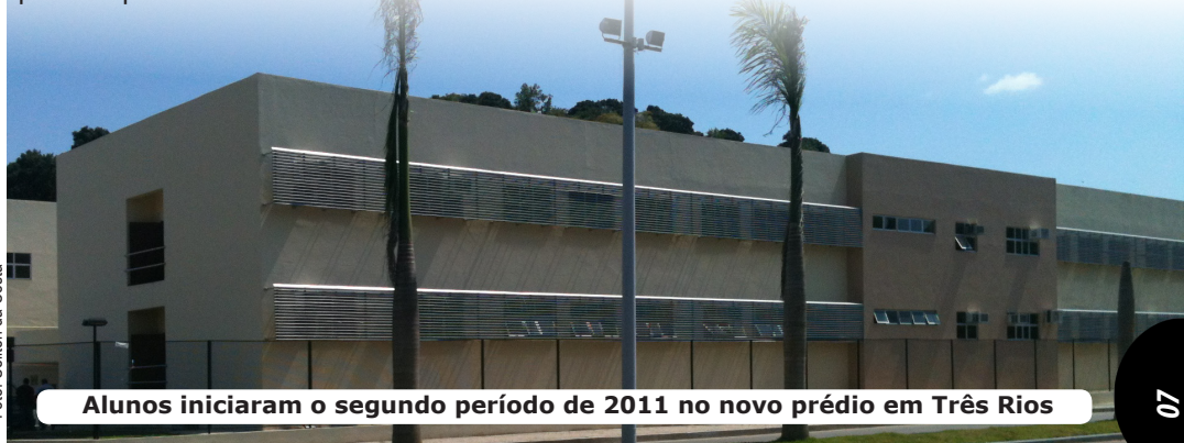
Alunos iniciaram o segundo período de 2011 no novo prédio em Três Rios