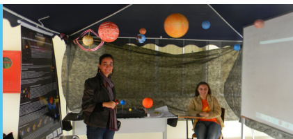
Estudantes expõem conteúdos com dinamicidade na SNCT em Nova Iguaçu.

O PIBID-Geografia IM realizou a exposição “Do passado ao futuro: As transformações do clima da terra através do tempo”, que teve sua primeira mostra no dia 21 de outubro. A exposição integra um projeto que se baseia na temática “Desvendando novas fronteiras: o uso de diversas linguagens para abordagem dos conteúdos curriculares da Geografia” e visa apresentar elementos da evolução geológica do planeta que viabilizem maior conhecimento sobre mudanças climáticas ocorridas no passado e seus efeitos.