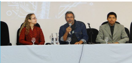
Semana de Computação promove interação entre discentes e profissionais .