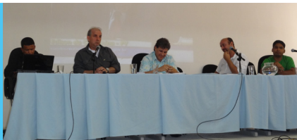
Representantes de órgãos e especialistas debatem gestão de áreas protegidas.