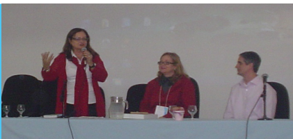
Congresso e Semana Acadêmica ocorreram simultaneamente no IM.

O I Congresso Nacional Multidisciplinar de Letras e III Semana Acadêmica de Letras – Identidade e Linguagens Hoje: Olhares sobre a Diversidade e a Inclusão – realizado entre 17 e 21 de outubro de 2011, contou com aproximadamente 350 pessoas e teve por objetivo criar um ambiente de interação e divulgação de pesquisas. Estiveram presentes professores ilustres de outras universidades brasileiras.