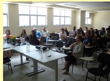
Profissionais e discentes discutem mudanças climáticas em mesa-redonda.

Quer se manter informado sobre o que se passa na Graduação da UFRRJ? Quais são as oportunidades, os eventos e as conquistas que a Universidade mais linda do Brasil te oferece?