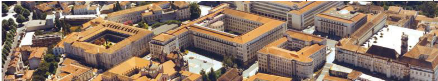
Foto do campus da Universidade de Coimbra - www.uc.pt

Os critérios para seleção eram ter cursado dois semestres da graduação, feito todo o ensino médio e pelo menos dois anos do ensino fundamental em escolas públicas brasileiras e terem sido aprovados integralmente nos estudos realizados. Além da Rural, participam do programa outras 27 instituições federais, que enviarão ao todo 196 alunos.