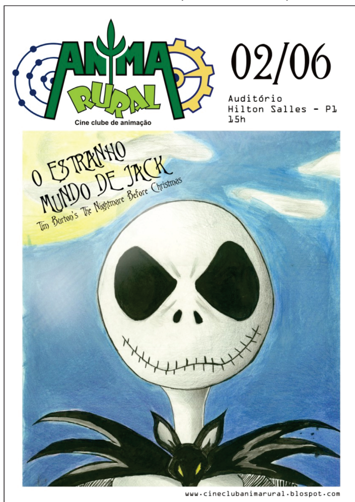
Primeiro cartaz do Anima Rural elaborado pelos estudantes de Belas Artes.