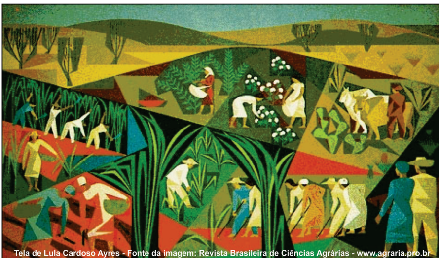
Tela de Lula Cardoso Ayres - Fonte da Imagem: Revista Brasileira de Ciências Agrárias - www.agraria.pro.br

Fonte: Assessoria de Imprensa do Inep/MEC