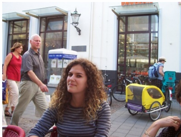
Graduanda de História da Rural realiza doutorado em Ciências da Comunicação na Universidade de Coimbra

As saudades que tenho do Brasil são enormes. Pretendo voltar tão logo que possa. Acredito que, tal como eu, muitos estudantes têm o desejo de ter uma experiência fora do país, e para esses quero deixar uma mensagem: estudem, tentem tirar boas notas e procurem publicar artigos, participar em congressos, nem que seja como ouvintes, pois isso, para aqueles que analisam os currículos, demonstra a dedicação do aluno na sua formação acadêmica!