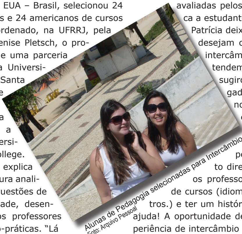
Alunas de Pedagogia selecionadas para Intercâmbio