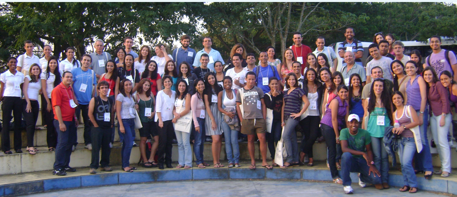
I Encontro realizado em 2010

Para integrar alunos e fazer com que estes conheçam a Universidade, neste mês, a Rural realiza o II Encontro dos alunos dos cursos à Distância e Presencial.