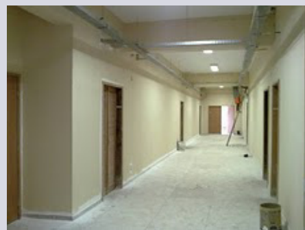
Imagens da maquete e da construção do novo prédio em Três Rios