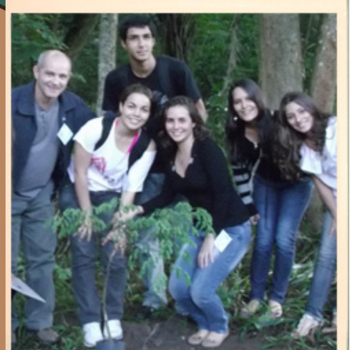
PET Dimensões da Linguagem participa do plantio organizado pelo PET Floresta

Tem como objetivo o trabalho de construção e estudo da matemática de forma a possibilitar o entendimento de problemas realistas, com hipóteses simplificadoras que, apesar de levarem ao abandono de vários aspectos da realidade, permite que se lancem mão de ferramentas matemáticas de uma maneira mais eficaz. Nessa perspectiva, a temática ambiental fornece vários exemplos que podem ser trabalhados com a matemática.