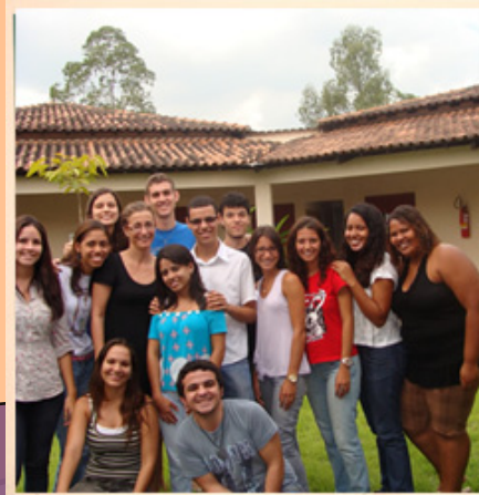
Integrantes do Grupo PET História