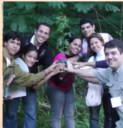
Alunos do PET Física em plantio de árvores durante I IntraPET da Rural

O PET Física “Experimentação e Novas Tecnologias no Ensino-Aprendizagem da Física”, foi o primeiro PET da UFRRJ. O grupo tem atividades que aproximam a Física da realidade dos estudantes, para isso, desenvolve, por exemplo, mini-cursos de Introdução aos Métodos Matemáticos da Física, voltados aos calouros do curso. De acordo com o tutor, Mauricio Cougo dos Santos, um novo projeto deve iniciar em breve: “Física para o segundo grau – apoio às escolas públicas”, com aulas de reforço para alunos do Ensino Médio de Seropédica.