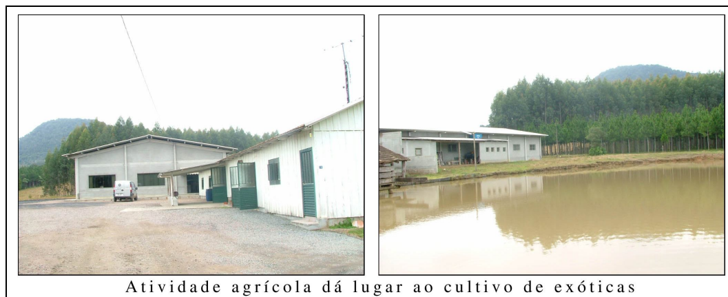
Figura 1: Instalações de uma facção sediada em propriedade agrícola

Constata-se que, por um lado, esse fluxo migratório rumo aos centros urbanos tende a enfraquecer a agricultura familiar no Alto Vale do Itajaí, o que dilui, pouco a pouco, a densidade do patrimônio cultural herdado dos imigrantes europeus. Por outro, ressentindo-se das dificuldades financeiras, os agricultores sentem-se mais e mais estimulados a vender parte de suas propriedades e a aproveitar o restante em projetos de reflorestamento com espécies exóticas – a exemplo do eucalipto (Figura 1).