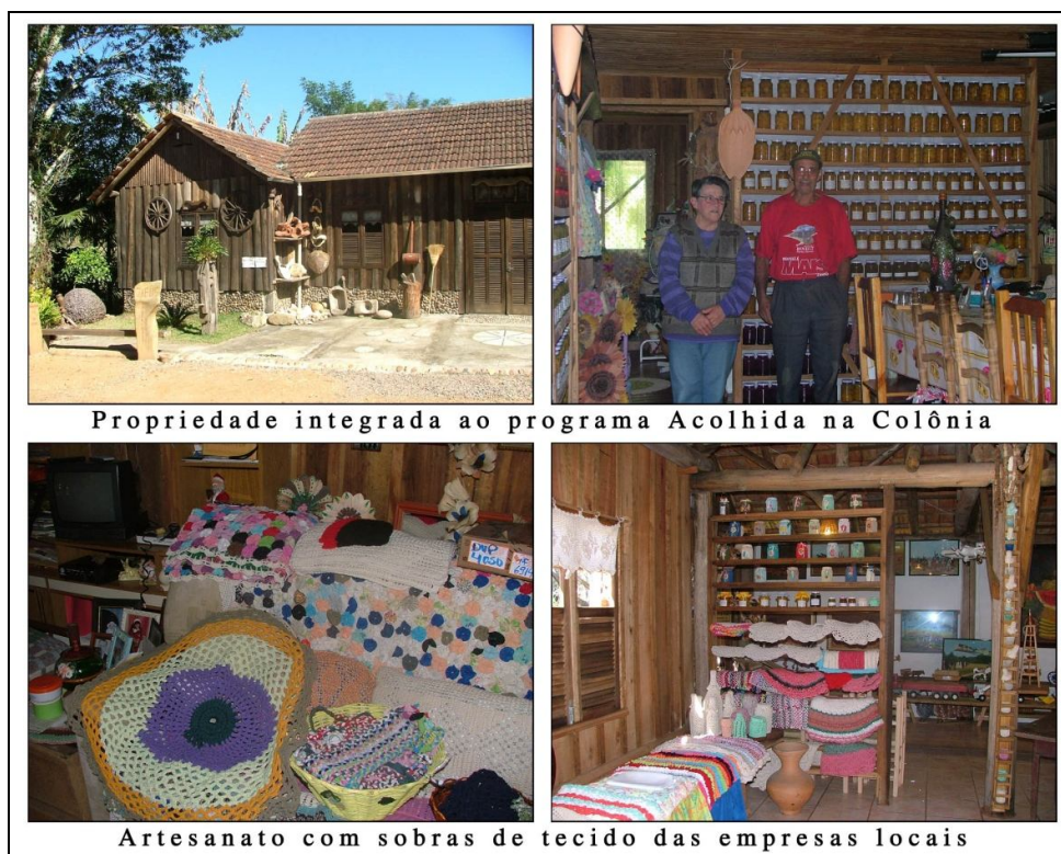
Figura 2: Propriedade que se integrou ao programa Acolhida na Colônia

que vêm sendo investidos, atualmente, no fortalecimento da agricultura familiar multifuncional na região.