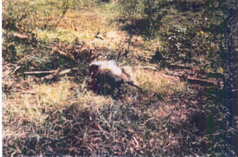
Fig. 4 – Gambá solto no mesmo local de captura.