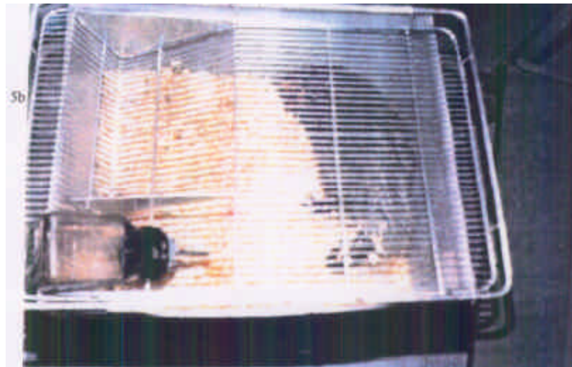
Fig. 5a – Infectório do IBEx mostrando o aparelho de UV. Fig. 5b – Caixa de PVC com maravalha.