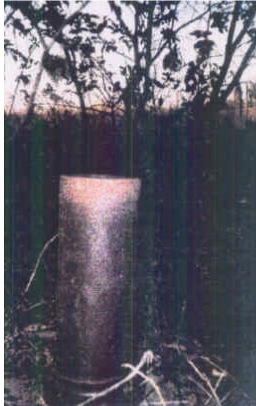
Figs. 1a e 1b – Manilha de barro utilizada para captura dos gambás.