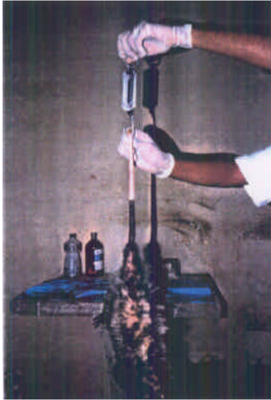
Fig. 2 – Pesagem dos gambás.